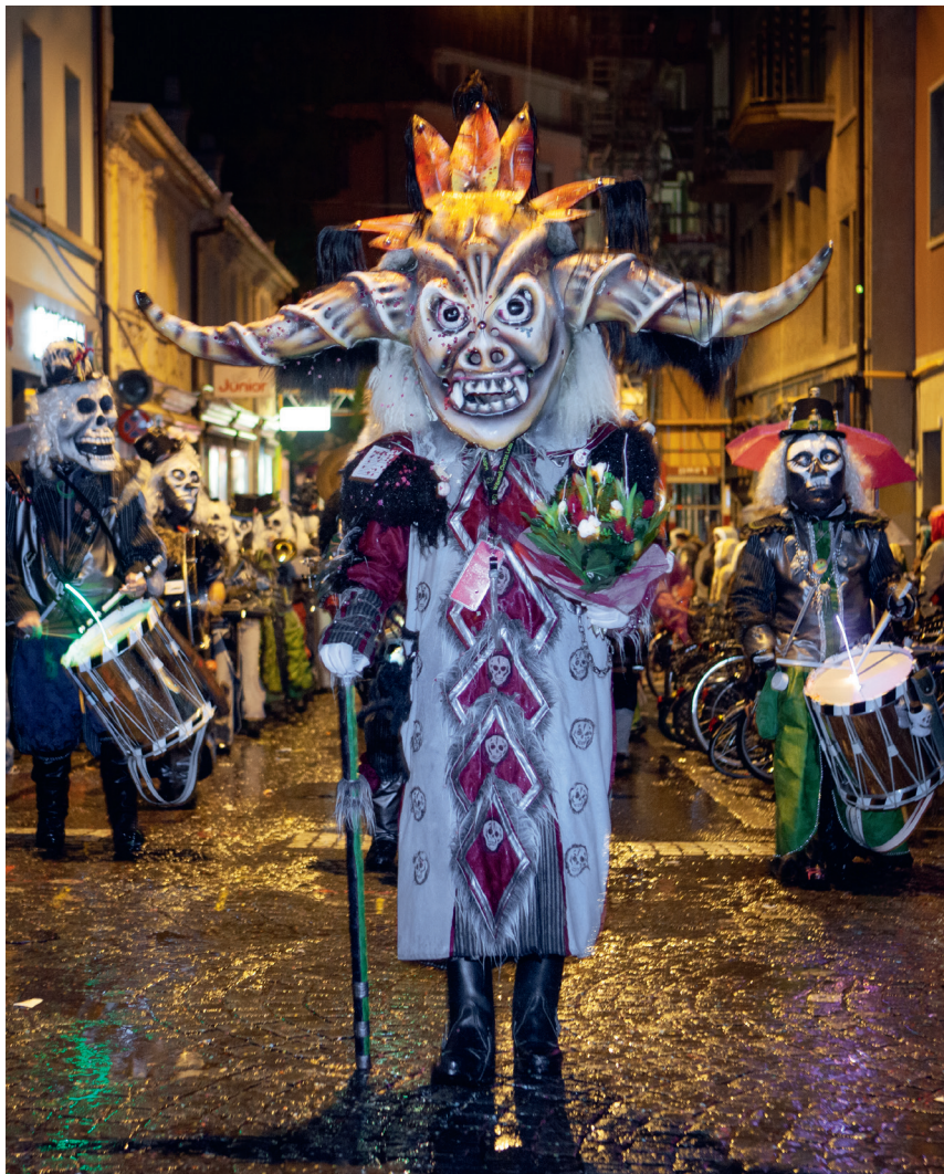
Monstercorso am Gütisdienstag.

koppelt sein. Die durch die «Vereinigten» gemeldeten Wagen werden am Gütisdienstag um 18.30 Uhr von der Feuerwehr beim Luzerner Theater kontrolliert. Siehe auch Hinweise auf www.vereinigte.ch .